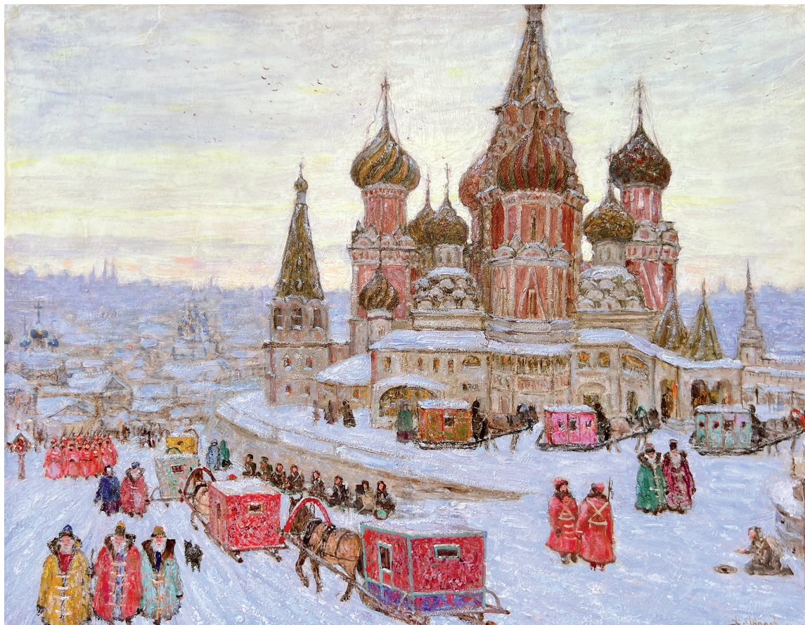
Аралов В.Н. Старая Москва XVII века. У храма Василия Блаженного

Сам архидиакон Павел и его сотоварищи по путешествию «дивились на порядки в церквах, ибо видели, что все, от вельмож до бедняков, прибавляли к тому, что содержится в законе, канонах и постановлениях типикона постоянные посты, неуклонное посещение служб церковных, непрестанные большие поклоны до земли даже по субботам и воскресеньям, хотя это не дозволено, пост ежедневный почти до девятого часа или до выхода от обедни, а не так, как повелевает закон поститься только по средам и пятницам». Участникам антиохийского посоль-