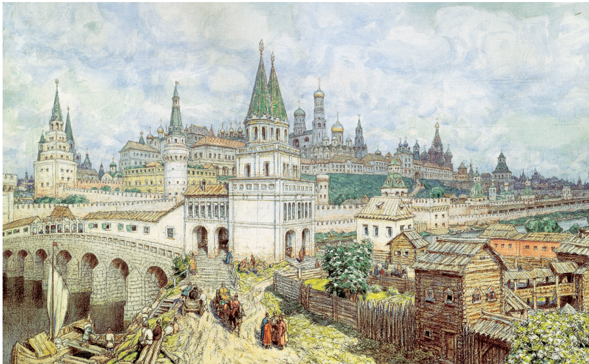
Васнецов А.М. Расцвет Кремля. Всехсвятский мост и Кремль в конце XVII века

Больше всего в «Путешествии» рассказано о Москве — городе тысяч церквей: «После многих расспросов я осведомился у архидиакона патриаршего о числе церквей