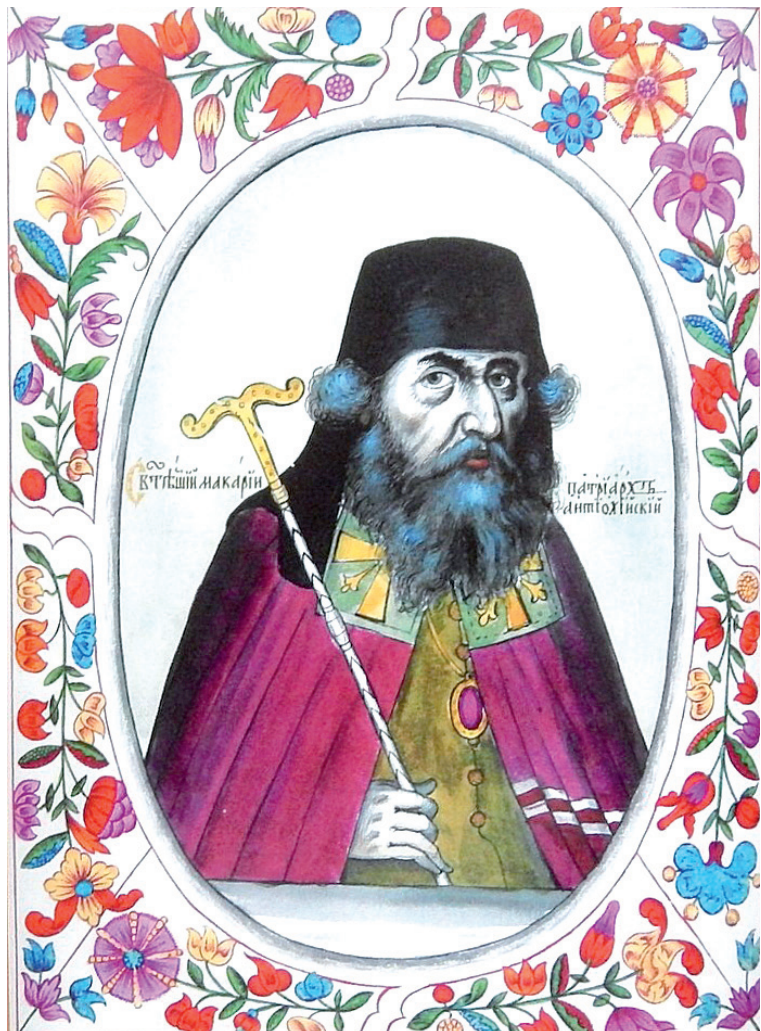
Патриарх Антиохийский Макарий III. Миниатюра Царского титулярника 1672 года